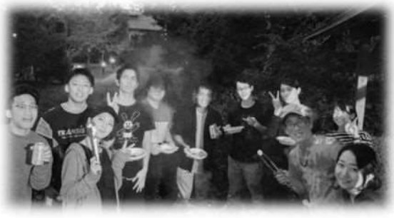
▲研究室キャンプのBBQの様子