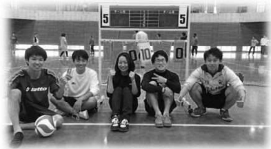
▲吹田祭バレーの出場選手たち