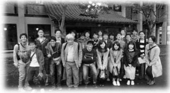
▲研究室旅行での集合写真